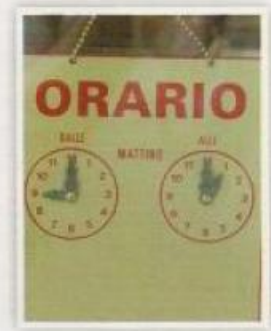
d. ufficio postale