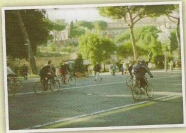
Una domenica senza macchine nel centro di Roma.