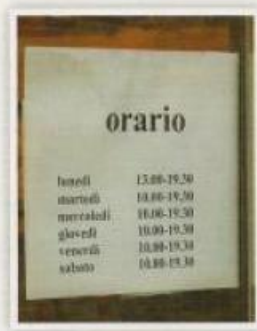
b. negozio di abbigliamento